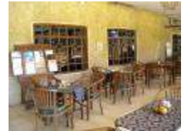
Tropical B. Bakery