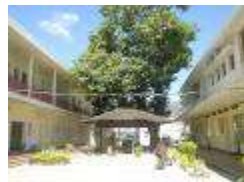
Plaza Hotel 中庭