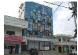
Sakura T. A. Hotel